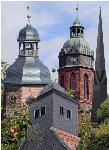
Vier Kirchtürme der Kirchengemeinde Einbeck:

Wir wünschen dir eine schöne Konfirmandenzeit!