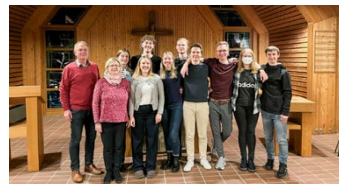
Teilnehmende aus den Kursen Lektorenausbildung U-25

Auch die Teilnehmer:innen der U-25-Kurse werden durch ein Mentorat des Ortspfarramts begleitet. So wird das Erlernete zwischen den Kursblöcken in Gottesdiensten in der eigenen Gemeinde eingeübt.