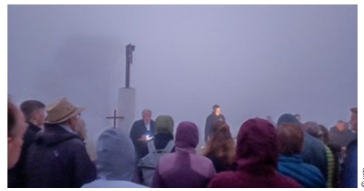
Ostermorgen auf dem Signal Hill, Kapstadt

„Auf, auf, mein Herz mit Freuden, nimm wahr, was heute geschieht; wie kommt nach großem Leiden nun ein so großes