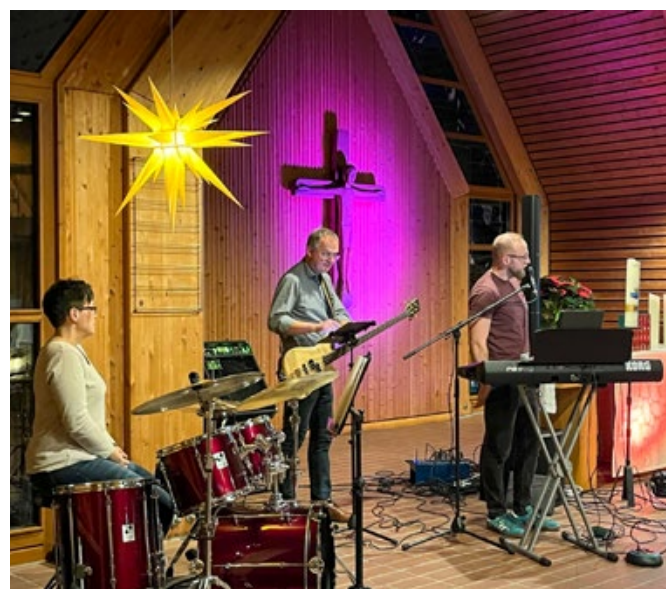
Aus dem gemeinsam vorbereiteten Gottesdienst

Immer wieder erreicht uns die Frage, ob die im Rahmen des Lektoren- oder Prädikantendienstes gezahlten Aufwandsentschädigungen bei der Steuerklärung angegeben werden müssen. Näheres dazu finden Sie hier: https://datenbank.nwb.de/Dokument1028287/